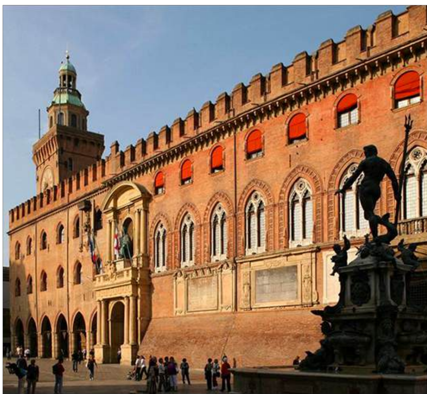
via Gherardo Ghirardini, 17