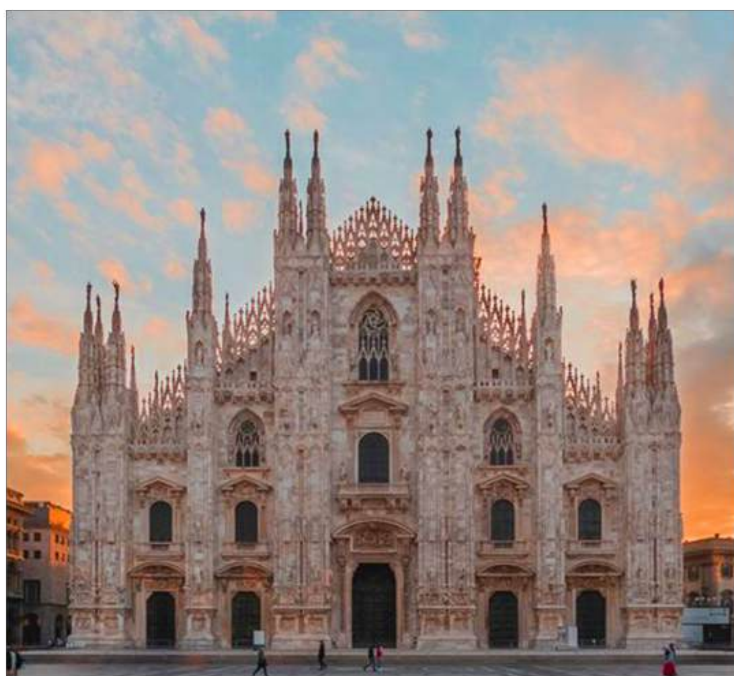
via Daniele Crespi, 9

L'Istituto è presente a Bologna e Milano, le città universitarie preferite dagli studenti , e le sue sedi sono collocate in quartieri e contesti di pregio, con tutti i servizi utili agli studenti, facilmente raggiungibili tramite i sistemi di trasporto pubblico e privato.