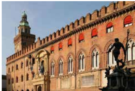
Via Gherardo Ghirardini, 17