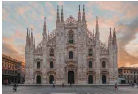
Via Daniele Crespi, 9

L'IBZ è presente a Bologna e Milano, le città universitarie preferite dagli studenti , e le sue sedi sono collocate in quartieri e contesti di pregio, con tutti i servizi utili agli studenti, facilmente raggiungibili tramite i sistemi di trasporto pubblico e privato.