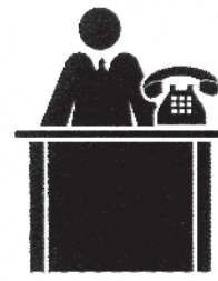
Ingegneri delle telecomunicazioni