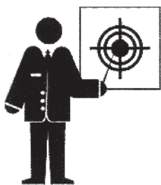
Esperti di marketing

La disoccupazione resta alta, eppure le imprese non riescono a coprire migliaia di posizioni: mancano ottici, chimici, biotecnologi... Ecco chi cerca chi.