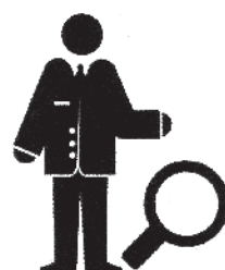
Specialisti in ricerca e sviluppo